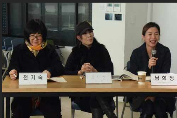
제 1차 정기총회 (2월20일)