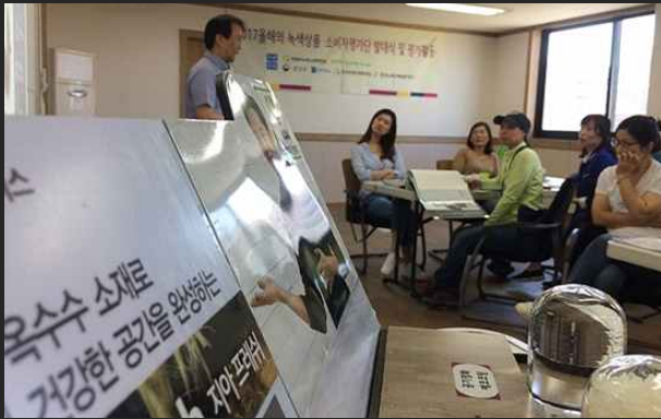
올해의 녹색상품 선정 패널단 (5월25일)