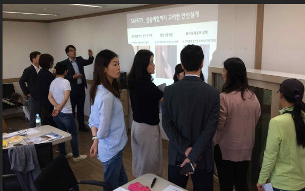
한국녹색구매네트워크 올해의 녹색상품 패널단