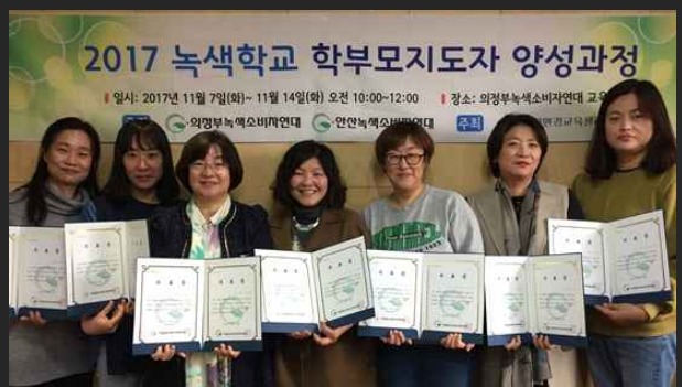
'녹색학교학부모지도자양성과정' 수료식 (11월14일)