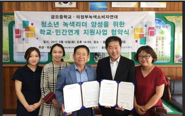
의정부금오중학교 협약식 (9월12일)