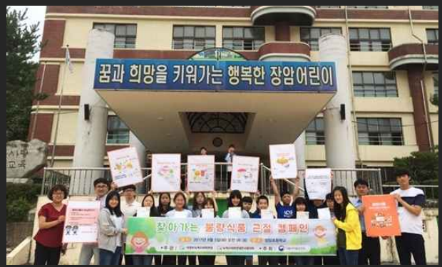
불량식품 캠페인 (9월5일)