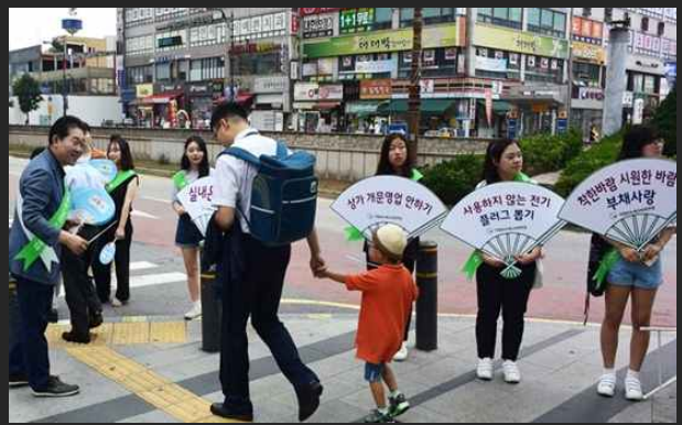
여름철 '에너지절약 캠페인' (8월19일)