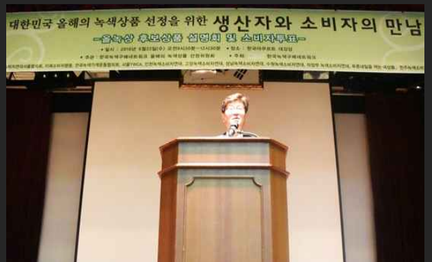
한국녹색구매네트워크 녹색상품 생산자와 소비자의 만남