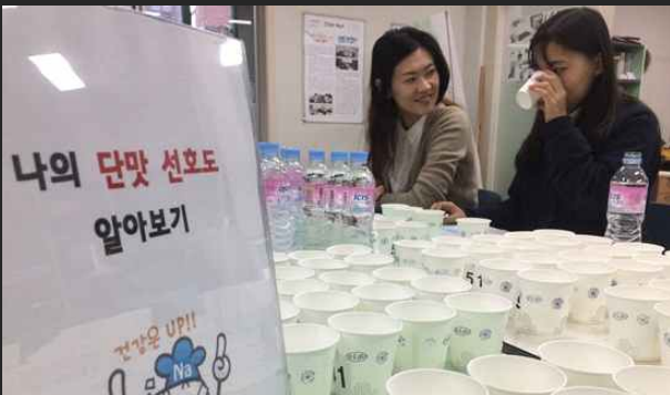
당·나트륨저감 교육 (10월11일)