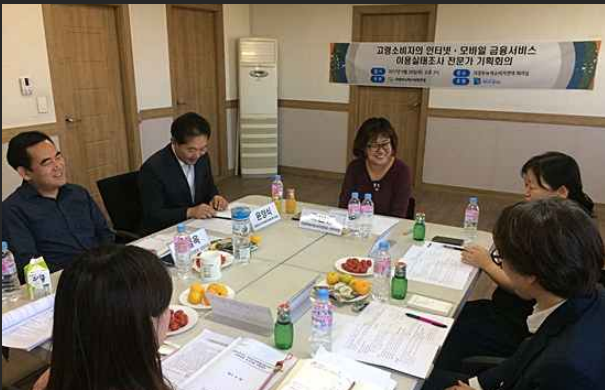
고령소비자 금융 모바일서비스 이용실태조사(9월28일)