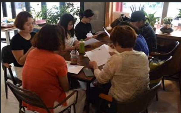
녹색살림생활지도자 상반기 평가회의(7월27일)