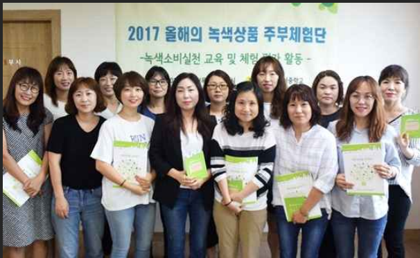
올해의 녹색상품 주부체험단 (8월24일)