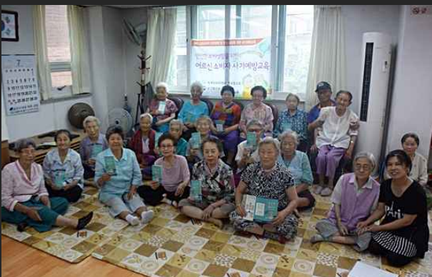
노인사기예방 교육 (7월13일)