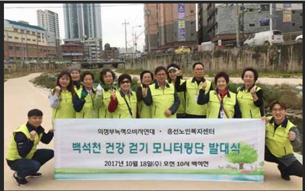
어르신 '백석천 건강걷기 모니터랑단' (10월18일)