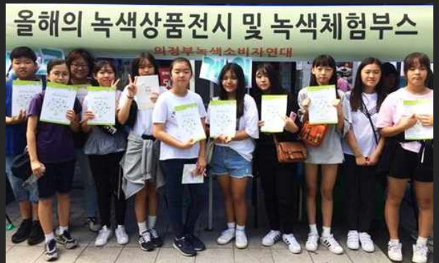
올해의 녹색상품 홍보 전시 부스 (9월16일)