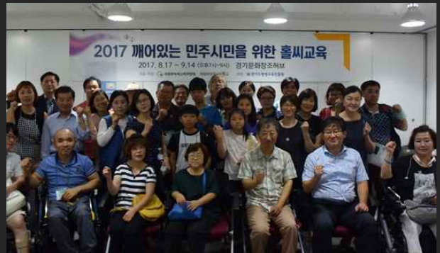
깨어있는 민주시민을 위한 홀씨교육 (8월17일)