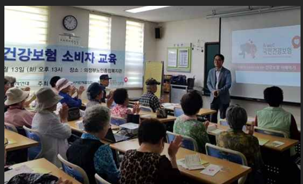
국민건강보험 교육 (6월13일)