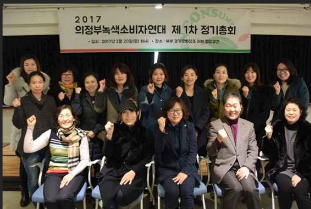
제 1차 정기총회 (2월20일)