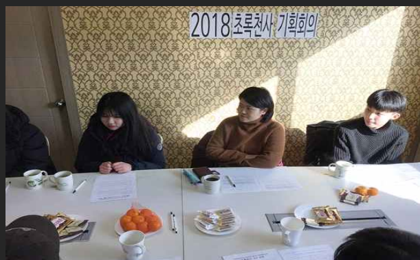
녹색살림생활지도자 초록천사 멘토 활동 (2월6일)