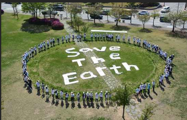
청소년에코볼런티어 '초록천사' (4월22일)