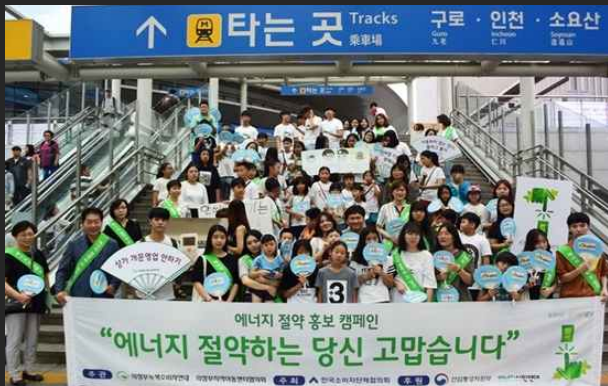
여름철 '에너지절약 캠페인' (8월19일)