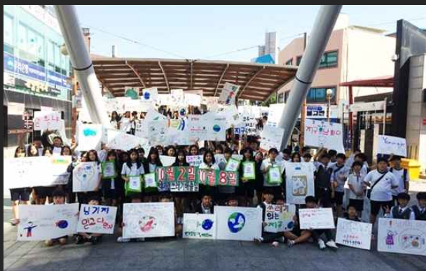
금오중학교 '녹색학교 만들기' (9월28일)