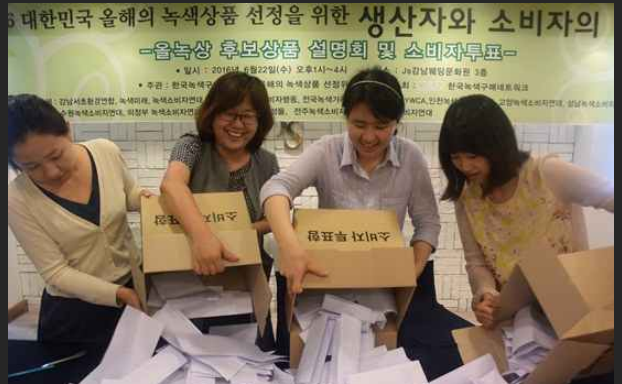
대한민국 올해의 녹색상품 소비자투표 (7월11일)