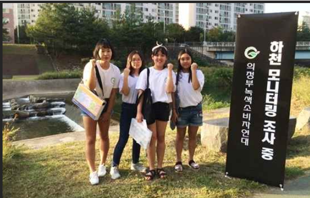
청소년 '중랑천·부용천 하천 모니터링단' (9월23일)