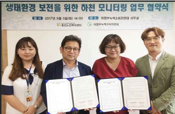
홍선노인복지센터 협약식 (9월5일)