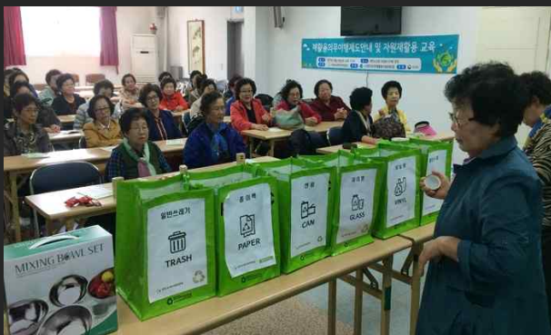
자원순환 분리배출 교육 (10월 19일)