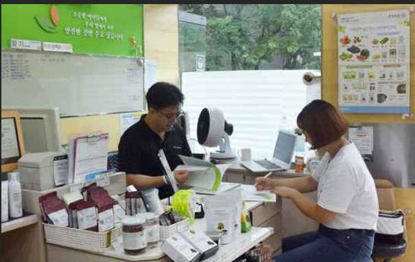
녹색매장지정 지원 컨설팅 (8월18일)