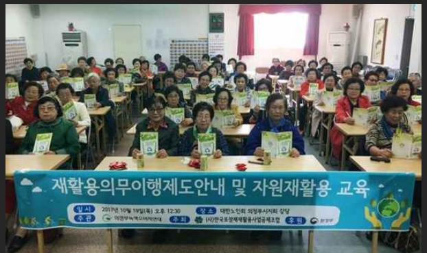
자원순환 분리배출 교육 (10월 19일)