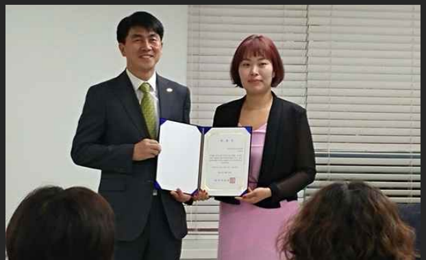
그린워싱·환경마크 모니터링단 발대식 (6월13일)