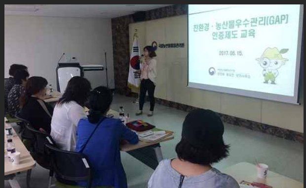
농산물품질관리 명예감시원 (6월15일)