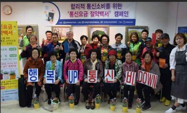
통신요금 절약백서 (4월18일)