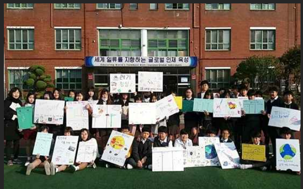
의정부서중학교 '녹색학교 만들기' (10월25일)