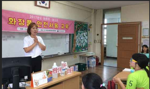
안전한 화장품 사용교육 (6월9일)