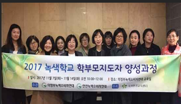
'녹색학부모지도자양성과정' 개강식 (11월7일)