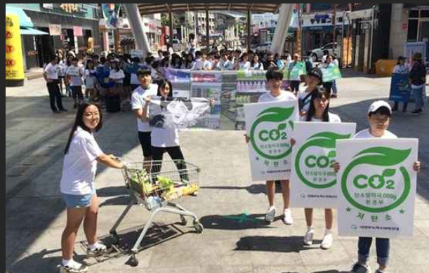
청소년에코볼런티어 '초록천사' (6월3일)