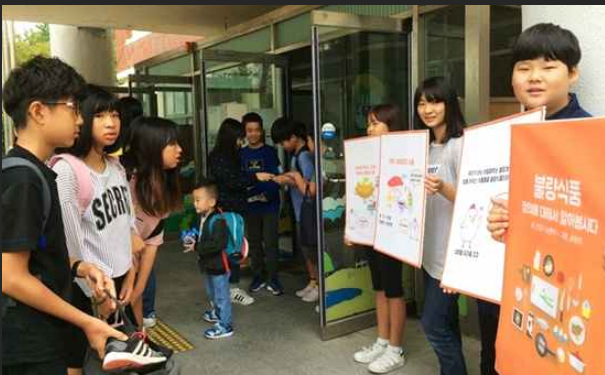
불량식품 캠페인 (9월5일)