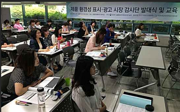
그린워싱·환경마크 모니터링단 교육 (6월13일)